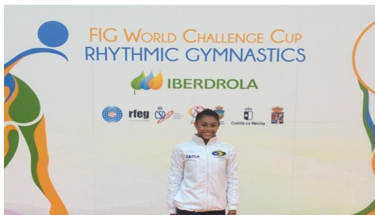
COPA DO MUNDO "ADULTO" De 03.05 á 06.05.2018 – GUADALAJARA/ESP

ASSOCIAÇÃO DE GINÁSTICA RÍTMICA CNPJ:08.004.169/0001-21 R: Pastor Manoel Virgínio de Souza, 1020, Bairro: Capão da Imbuia CEP:82810-400 - CURITIBA/PR